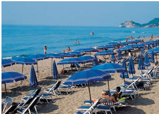
Entspannung am Meer