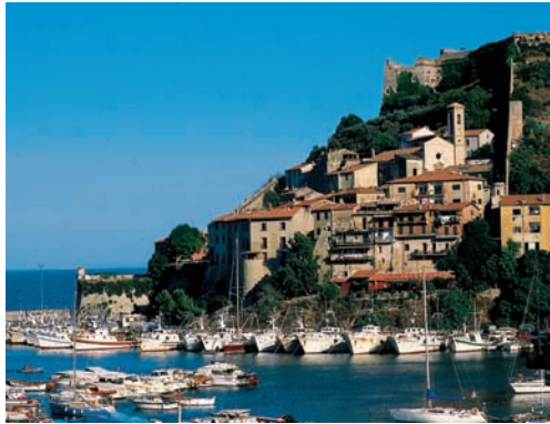
Besuch in einem Fischerdorf