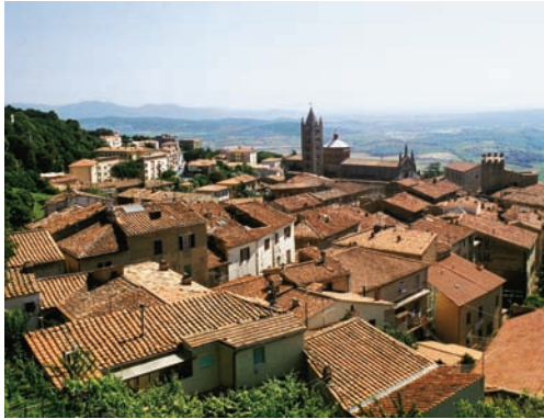
Ausflug nach Massa Maritima