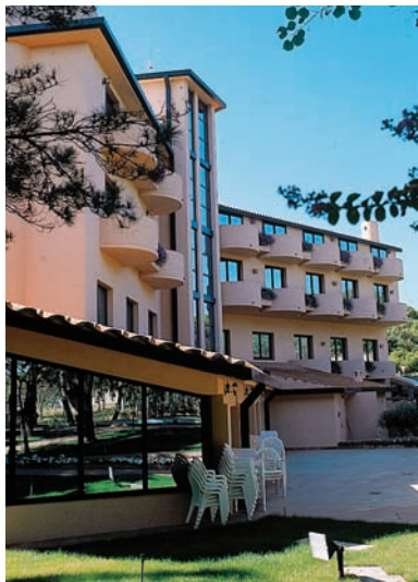
Das Parkhotel Zibellino