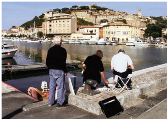
Malen in Castiglione della Pescaia